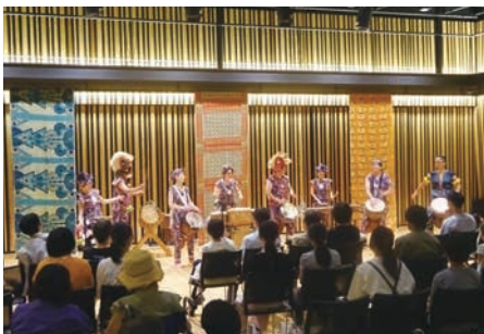
イニセアフリカによるワークショップ