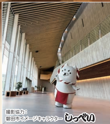
撮影協力： 磐田市イメージキャラクター じゅっぺ